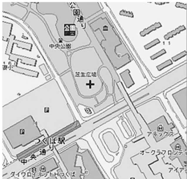
デモ&パレードコース・駐車場案内図